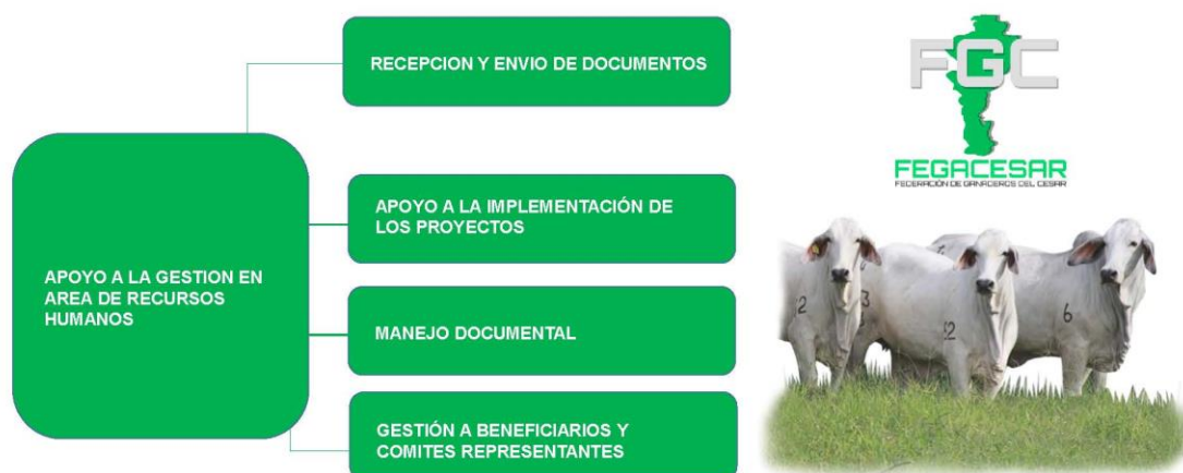
Gráfico 2

A continuación, se presta las actividades asignadas por la empresa en el área de recursos humanos y dirección técnica.