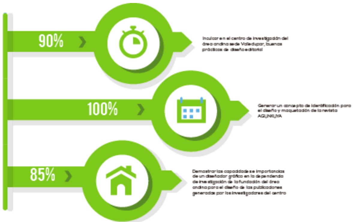
Tabla 2. Logros alcanzados.