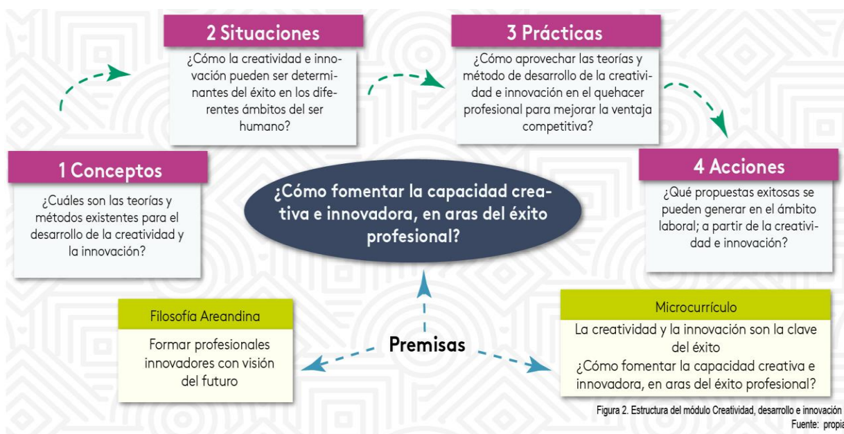
Figura 1. Estructura del módulo Creatividad, desarrollo e innovación I .