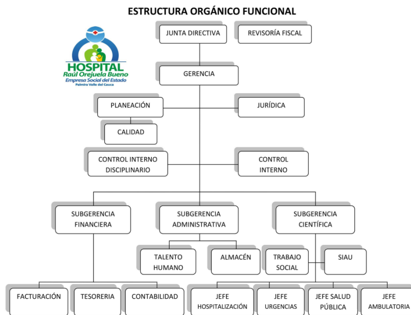
Figura 2. Estructura organizacional del Hospital Raúl Orejuela Bueno.