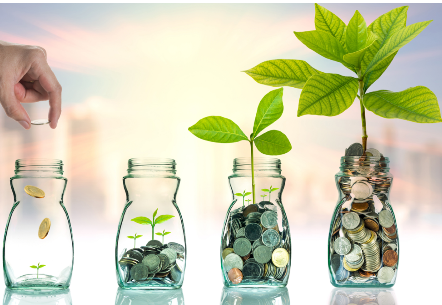
Figura 1. Representación de inversión

Una de las características más importantes es la confianza, puesto que los usuarios de la información toman decisiones frente a la información financiera generada por el ente. Esto hace que exista seguridad frente al intercambio y al mejoramiento de los mercados, y que disminuya la incertidumbre ante los negocios.