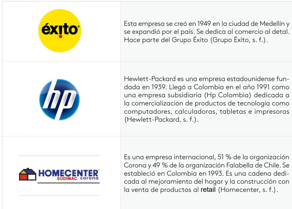
Tabla 10. Ejemplos de empresas comerciales

Existen diferentes empresas en Colombia de tipo industrial y manufacturero. Por ejemplo: