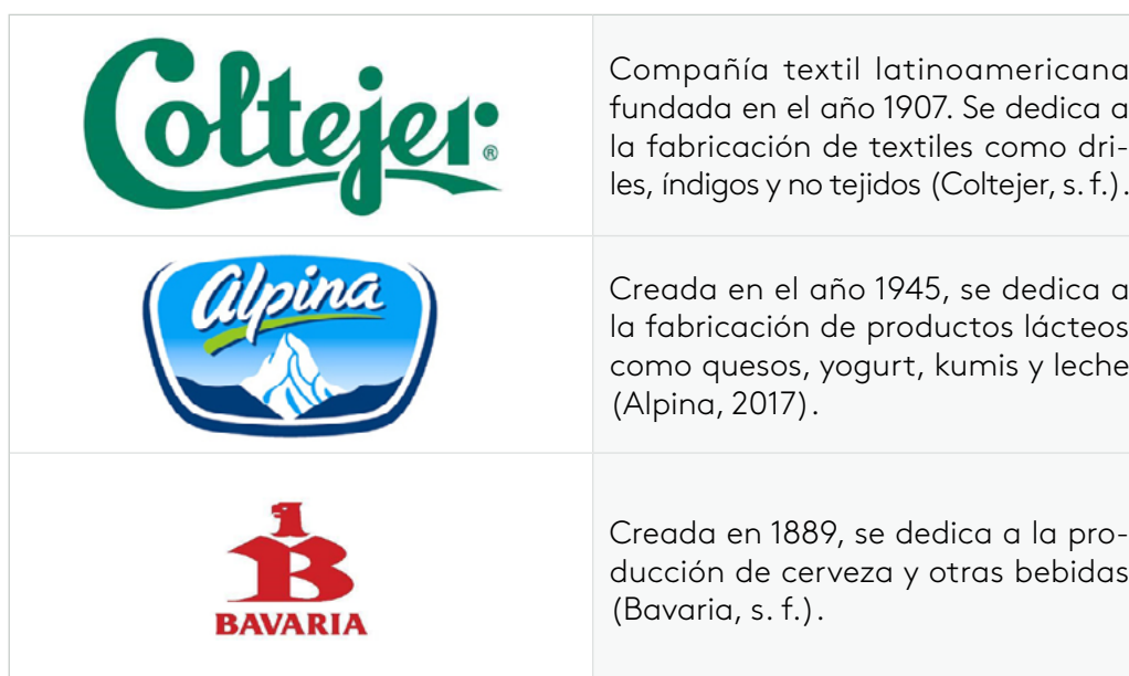
Tabla 6. Ejemplos de empresas industriales y manufactureras en Colombia

En Colombia existen diferentes empresas de tipo industrial y manufacturero, por ejemplo: