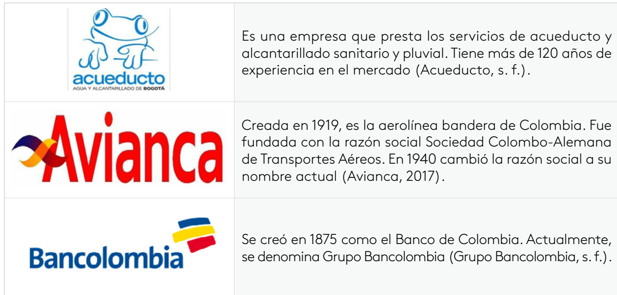
Tabla 8. Ejemplos de empresas de servicios

En Colombia existen diferentes empresas de servicios: