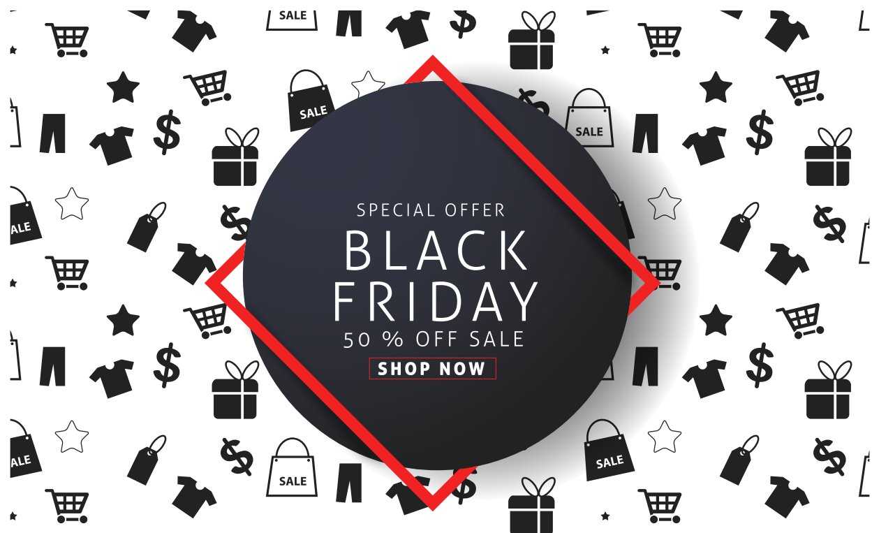
Figura 2. Black friday como representación de empresas comerciales

Las empresas comerciales se dedican a la compra y venta de bienes a un costo determinado, es decir, son las intermediarias entre el productor y el consumidor. No sufren ningún tipo de transformación.