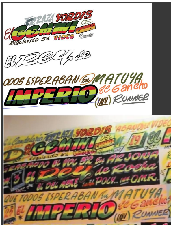
Vectorización de carteles de picho de Cartagena