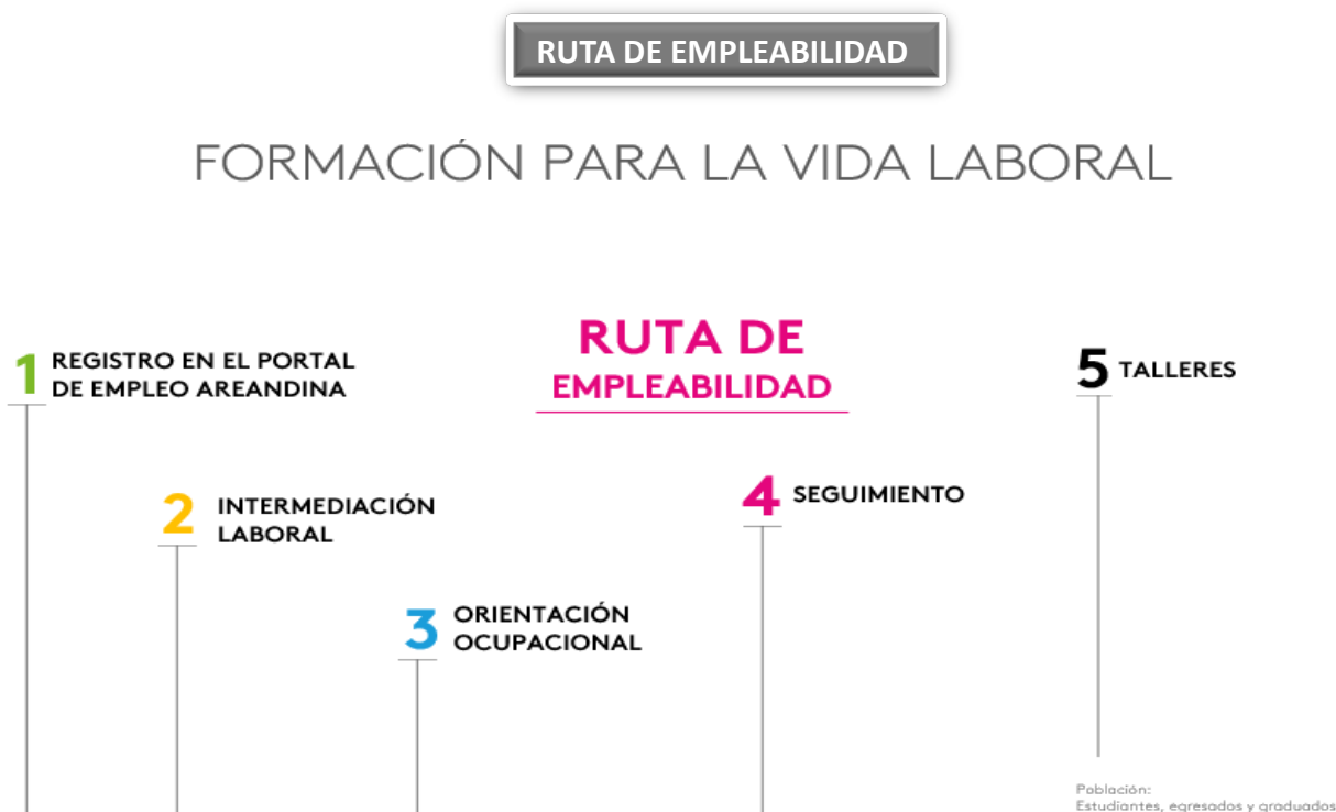
Imagen 1: Dirección Nacional de Graduados (2021). Ruta de Empleabilidad.

Artículo 17. Articulación de acciones con empleadores. El eje Impacto del Sistema Integral al Graduado Areandino (SIGA) propende por seguir cultivando en los graduados el espíritu de orgullo por su institución, para que sean ellos los embajadores que aporten en el proyecto académico y en los procesos de desarrollo social, cultural, científico, tecnológico y económico, en sus respectivos entornos. Potenciar el relacionamiento con los graduados y empleadores para propender por una relación continua.