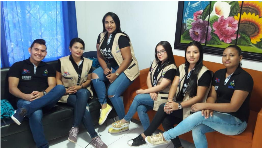
Anexo A. Grupo de trabajo del proyecto