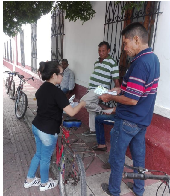
Anexo D. Actividad: Entrega de volantes entre la calle 13 y 20 sobre la carrera 16