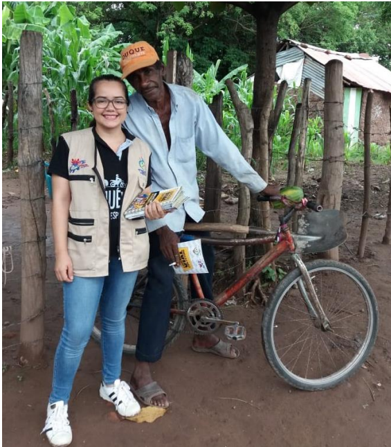
Anexo C. Actividad: Entrega de cartillas y psicoeducación en el barrio la antillana