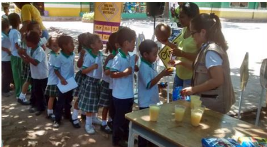
Anexo B. Actividad: Capacitación en la Institución educativa Antonio Galo Lafaurie, sede Martínez Barbosa