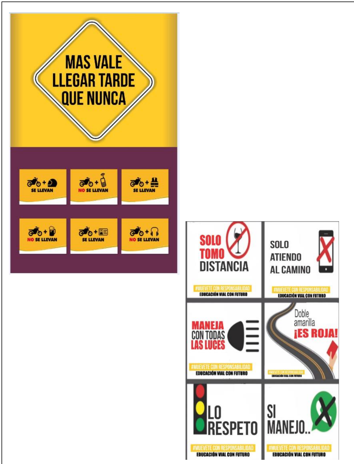
Anexo E. Actividad: Volantes entregados a la comunicad de Agustín Codazzi.