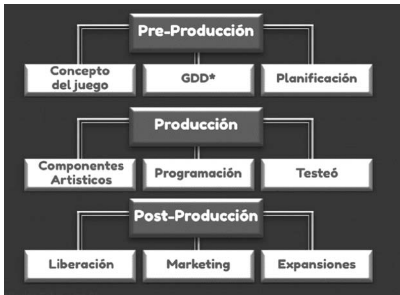
FIGURA 1. Modelo de desarrollo del videojuego.

do un breve resumen de las fases que ha seguido él mismo: