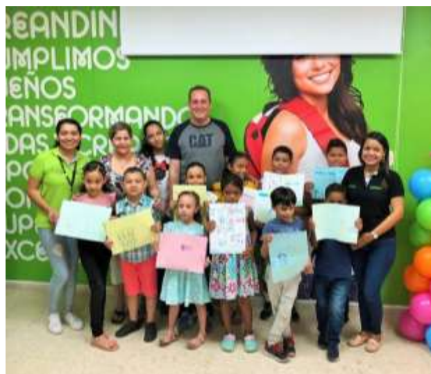
Fotografía 10. La señora de los libros. Sesión de febrero de 2019 lecturas con Librín Valledupar