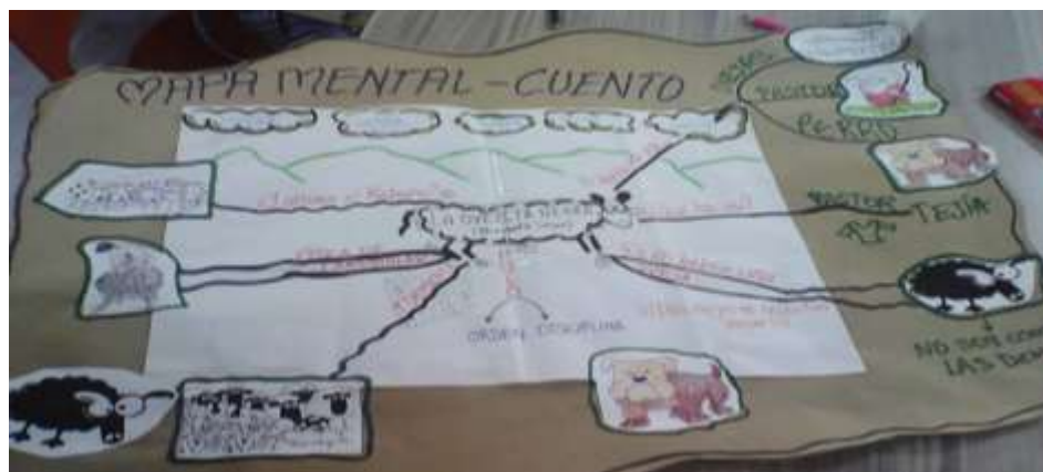
Fotografía 7. Mapa mental del cuento la ovejita negra (Elizabeth Shaw). Sesión de marzo 2019 lecturas con Librín Pereira.

Caligramas y Haikús como una forma breve de poesía japonesa, busca rescatar la memoria de un instante como si fuese un relámpago en versos de cinco, siete y cinco sílabas. En esta ocasión, la intención fue acercar a los niños a una forma lúdica de hacer arte con las palabras. Para este propósito, se instaló con antelación un árbol de caligramas y una cartelera sobre el haikú con ejemplos de este género. Los asistentes crearon sus propios caligramas con base en pequeños poemas descriptivos que facilitaban reproducirlos de manera gráfica, de esta forma, se incitó a ver la palabra más allá de la decodificación de símbolos como una forma de arte. Seguidamente, para esta actividad se leyeron haikús, solamente con la intención de que los niños sintieran lo que les producía este tipo de lectura. Los resultados son sorprendentes porque muchos niños, aún sin entender la profundidad de un haikú entendieron que la finalidad era captar el momento en tres pequeñas frases.