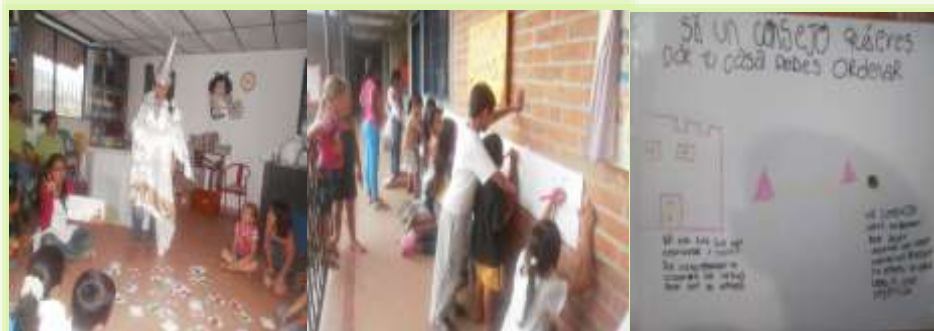
Equipo de trabajo biblioteca Pereira, 2012