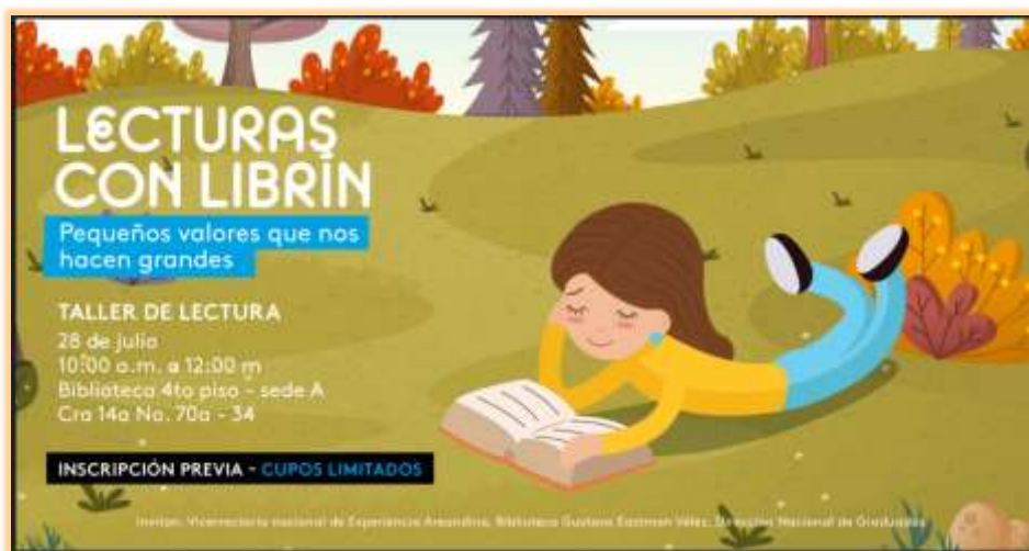
Fotografía 9. Actividad valores pequeños que nos hacen grande. Sesión de Julio de 2018 lecturas con Librín Bogotá

cuento “El niño y los clavos”, haciendo preguntas de reflexión sobre los estados de ánimo. (enojo, mal genio, felicidad, alegría) y cómo estos pueden influir en el relacionamiento con las personas que están en nuestro entorno. Además, se trabajó el cuento “Todos somos diferentes”, enfatizando la importancia de ser tolerante tener respeto por la diversidad de ideas y pensamientos de las personas a nuestro alrededor. La actividad finalizó con la elaboración de un mural de acuerdo a la temática del cuento.