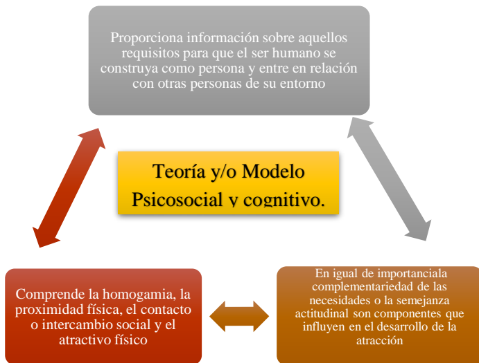
Figura 2. Definición de la teoría y/o modelo Psicosocial y cognitivo.