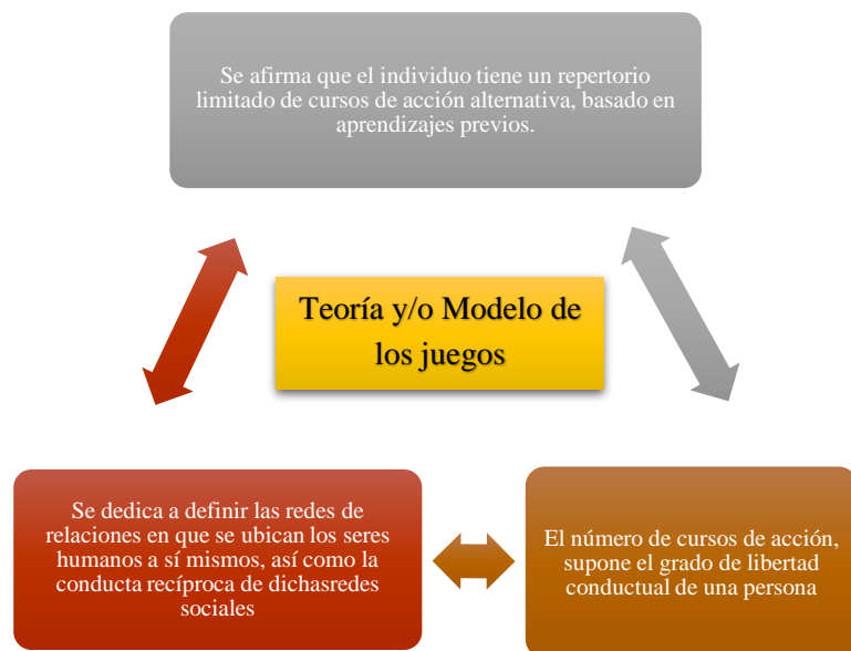
Figura 4. Definición de la teoría y/o modelo de los juegos.