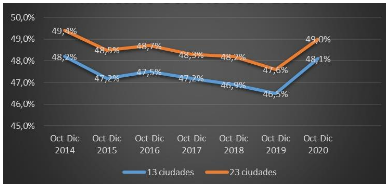
Índice de ocupados informales trimestre Oct – Dic 2014 a 2020