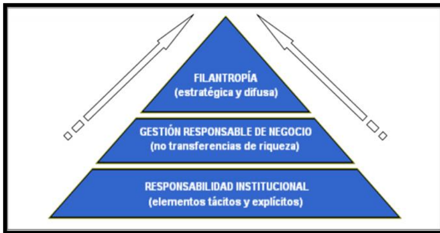
Figure 2 Pirámide de responsabilidad social.

Tomado de: (Parra, Pizarro, & Diaz, 2015, pág. 9)