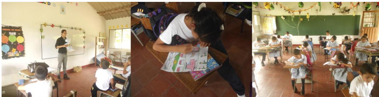
Ilustración de la imaginación

Cuando Tito decidió empezar a ilustrar se encontró bloqueado. No sabía cómo representar este mundo tan mágico, así que decidió ir a la escuela de su pueblo General Santander de San Pedro De Jagua. Allí realizó un taller ilustrativo con todos los estudiantes, a los que les narro el cuento “Nuestras casitas del Caracol” y pidió que dibujaran lo que imaginaban.