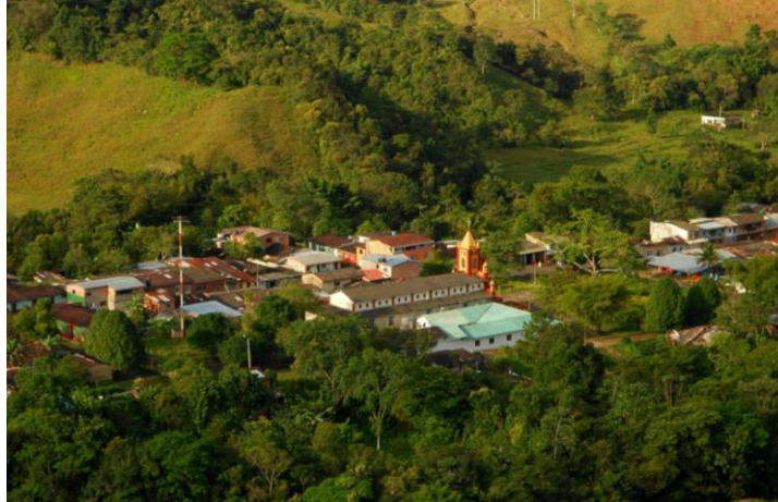
San Pedro de Jagua - Ubalá