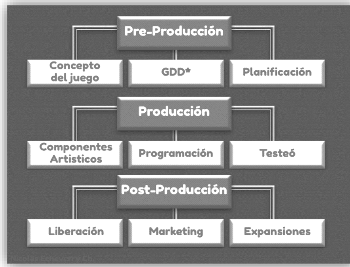
Fig. 1. Modelo de desarrollo del Videojuego

A continuación se ofrece una descripción del proceso metodológico que siguió el desarrollo del videojuego en paralelo a la investigación. Presentando un breve resumen de las fases que ha seguido él mismo: